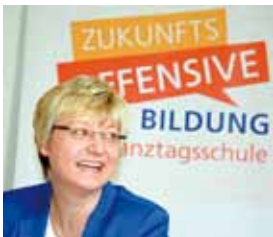
Frauke Heiligenstadt Niedersächsische Kultusministerin

Auf dieser Grundlage werden Sie eine fundierte Entscheidung für den weiteren Bildungsweg Ihres Kindes treffen können. Ein glückliches Kind, das den Anforderungen der gewählten Schulform motiviert begegnet, sollte das gemeinsame Ziel sein.