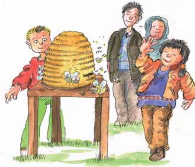
بیرون رفتن به محل های خارج از مدرسه برای مثال یک دیدار در مرکز بیولوژی مدارس