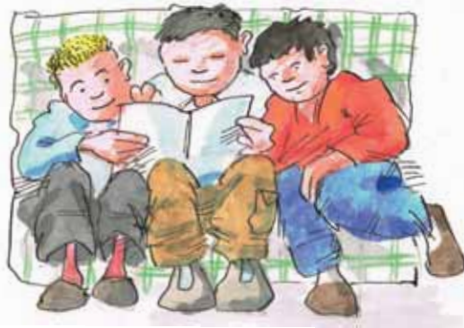
کتاب خواندن با هم دیگر

قوانین زبان آلمانی / موضوع های تدریسی / برابری امکانات برای همه / ارتباطات / بازی و تفریح / عمل و اقدامات / س ا ل پ / زبان تحصیلی / با هم بودن فرهنگی / تلفیق اجتماعی