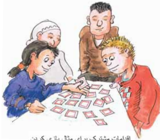
اقدامات مشترک برای مثال بازی کردن