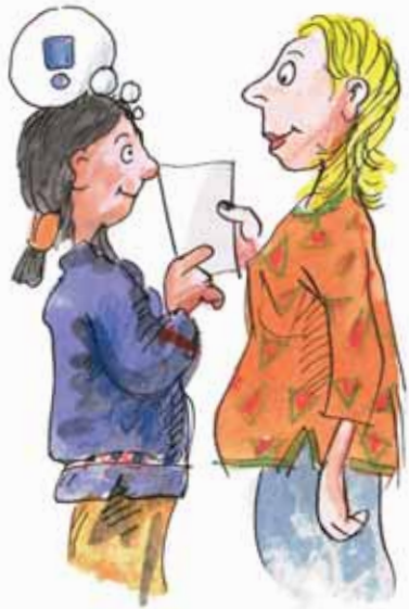
در صحبت - تعریف کردن و سوال کردن