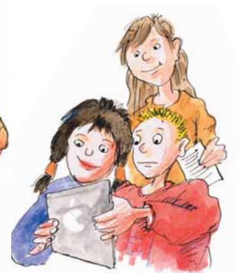
یادگیری رفتار با وسایل آموزشی