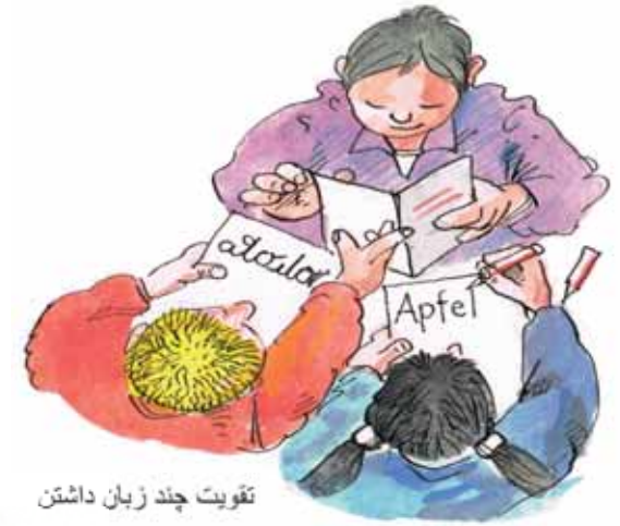
تقویت چند زبان داشتن

این برنامه کوله پشتی مدارس برای والدین و فرزندان آنها از کلاس اول تا کلاس چهارم و همینطور برای مدارس ابتدایی است و هزینه ای برای والدین ندارد. هدف این است که کودکان در راه خودشان به مدرسه و موفقیت های تحصیلی از طریق والدین شان همراهی و حمایت شوند. (انجام مشق های توی خانه، کتاب خواندن، کارهای مشترک و چیزهای مثل اینها). شهر هانو فرم خواهد با همکاری بسیاری از مدارس ابتدایی والدین و فرزندان آنها در یادگیری زبان آلمانی و چند زبانی و در فرهنگهای مختلف تقویت و تشویق کند.