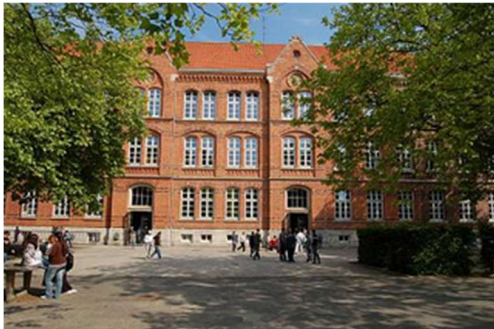
Grund- und Hauptschule Pestalozzistraße