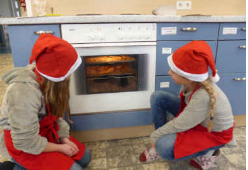
Kekse backen - Klasse 4a