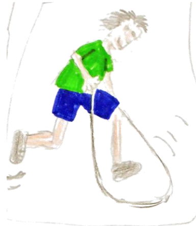
7 Schritte laufen