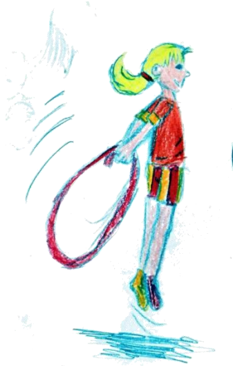
5x rückwärts Schlussprung