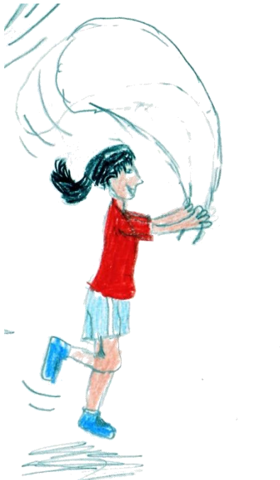
5x auf einem Bein