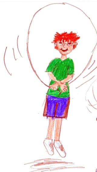
5x gekreuzte Arme