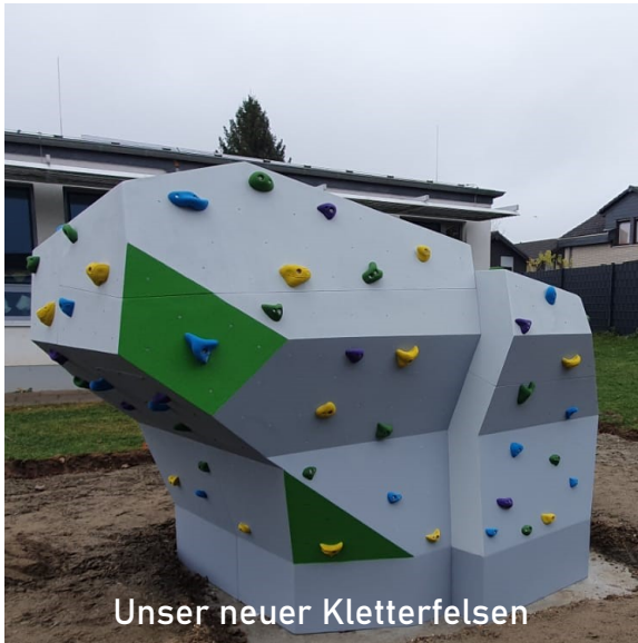
Unser neuer Kletterfels