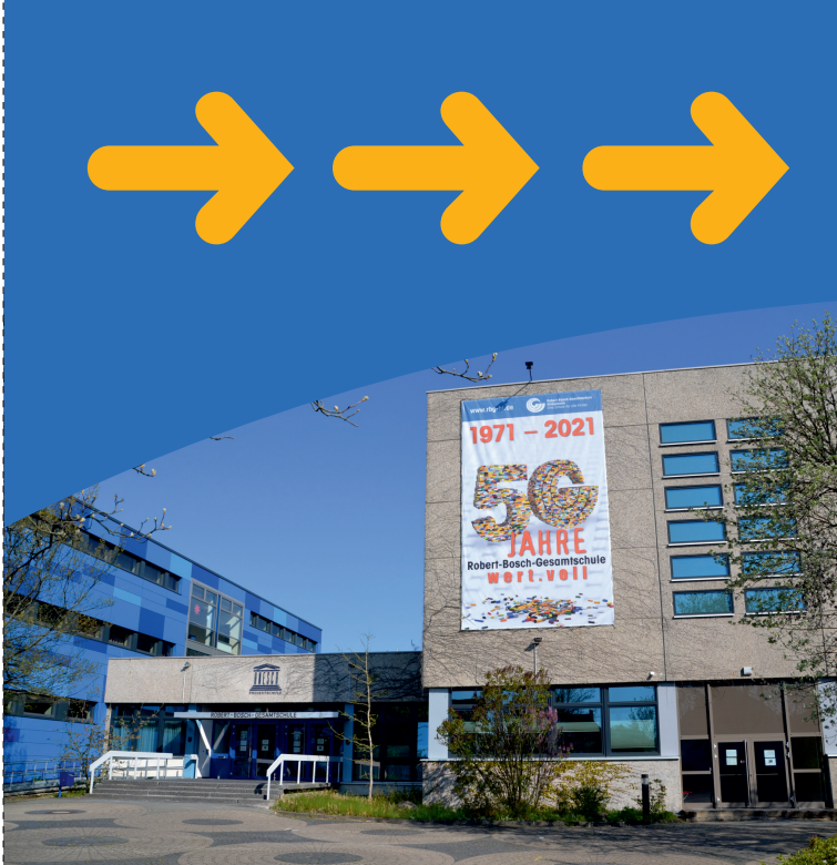
Gestaltung: Britta Nickel-Uhet, Sibbesse / OT Hönze